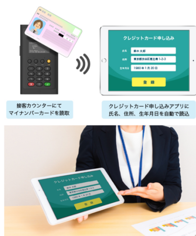
イメージ図 接客カウンターでのマイナンバー読取

携帯電話や生命保険の契約、クレジットカードの申し込みなどに際しての本人確認のデジタル化を推進し、かつ入力の手間やミスを無くすアプリケーションが実現可能になります。