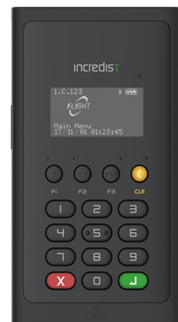
Incredist Premium II

一方で、2016年1月から開始されたマイナンバー（個人番号）制度ですが、現在では約2100万枚、普及率は16.8%になっています。本年9月からはマイナポイント（キャッシュレス決済で付与されるポイント）によるポイント付与や、2021年3月からは健康保険証としても利用できるようになる予定で、今後も様々な場面で広く活用されることが期待されています。